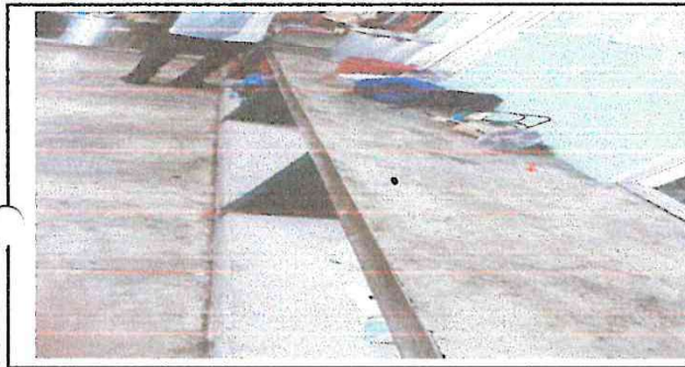
Foto 5: pared y muebles de cocina donde se colocara forro de azulejo