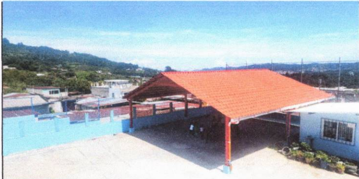
Foto 3: instalación de estructura en el area del patio para cubrir a los estudiantes del calor