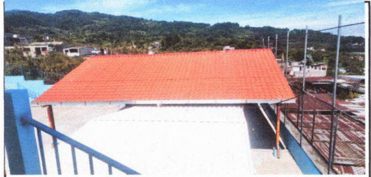
Foto 2: instalación de estructura en el area del patio para cubrir a los estudiantes del calor