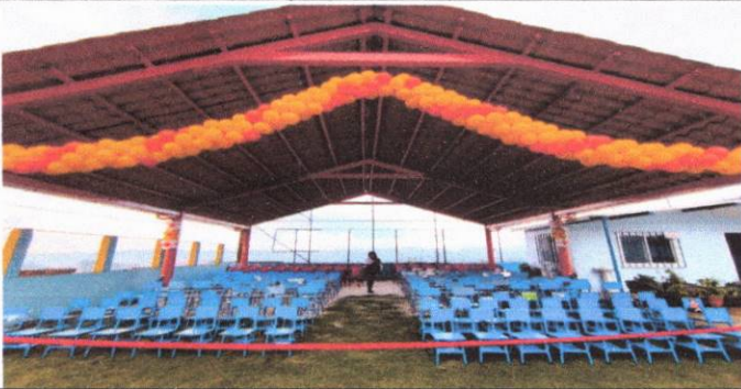
Foto 1: Instalación de estructura en el area del patio para cubrir a los estudiantes del calor.