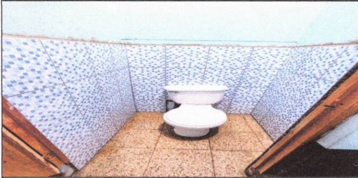
Foto1: sustitución de baño tipo baby para atención a niños de este nivel