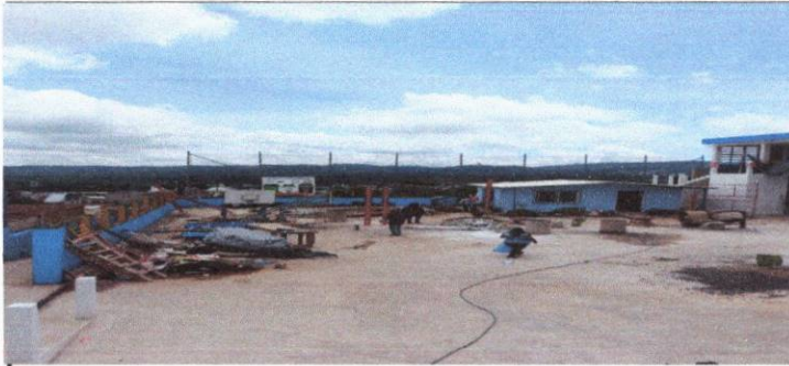
Foto 3: Instalación de estructura en el area del patio para cubrir a los estudiantes del calor