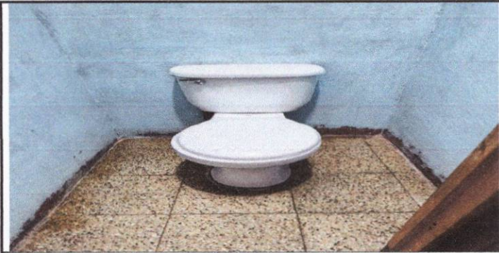
Foto1: sustitución de baño tipo baby para atención a niños de este nivel