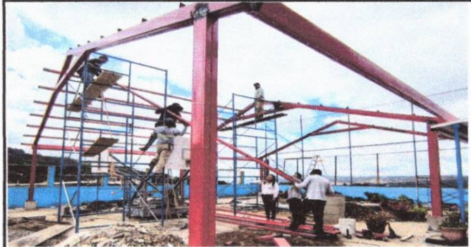
Foto 2: instalación de estructura en el area del patio para cubrir a los estudiantes del calor