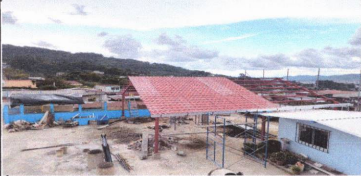
Foto 1: Instalacion de estructura en el area del patio para cubrir a los estudiantes del calor.