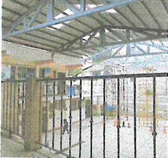
Foto 1: En la fotografía se observa el avance del techado sobre el patio de la escuela.