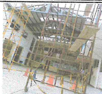
Foto 2: Vista desde un segundo ángulo del área del techado que se está trabajando.