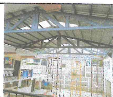
Foto 6: Fotografía desde un sexto ángulo, pueden observarse las tijeras colocadas, las costaneras, la lámina de polycarbonato y la lámina de aluzinc blanca preprintada.

Observación: Si es necesario se pueden agregar hojas adicionales y actualizar el número de hojas.