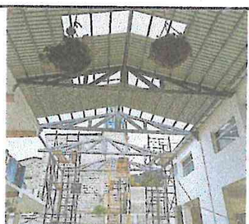
Foto 4: Fotografía de los trabajos en el techo desde un cuarto ángulo.