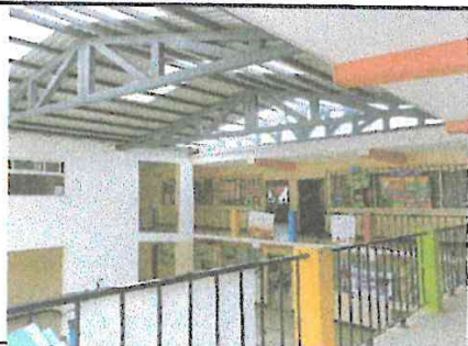
Foto 5: Fotografía de los avances del techado desde un quinto ángulo.