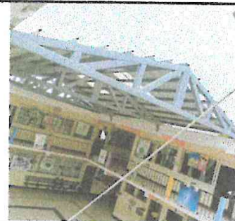
Foto 3: Fotografía de la vista desde un tercer ángulo del área que se está cubriendo.