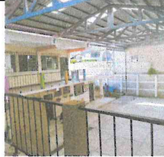
Foto 2: Fotografía de un segundo ángulo el techo del patio finalizado