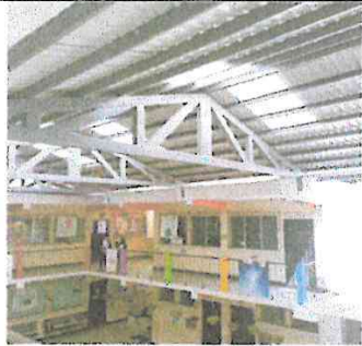
Foto 1: Se observa desde un primer ángulo los trabajos realizados.