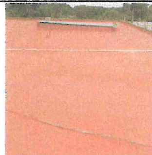
Foto 4: Los pañuelos poseen debajo de la capa de impermeabilizante la capa de cernido.