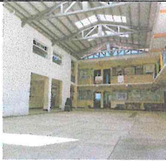
Foto 3: Fotografía de un tercer ángulo de el techo completamente finalizado.