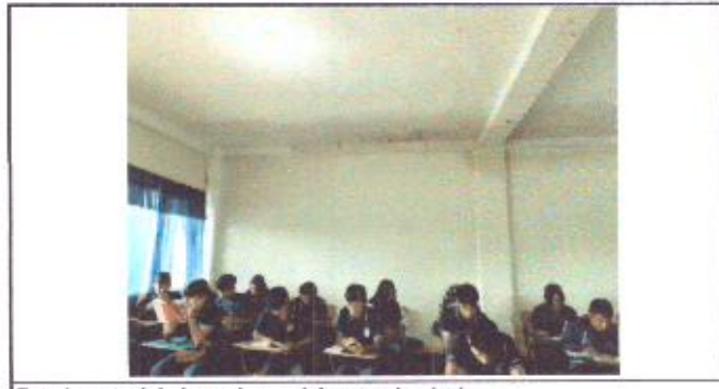
Estado actual de los salones del segundo nivel.

Observación: Si es necesario se pueden agregar hojas adicionales y actualizar el número de hojas.