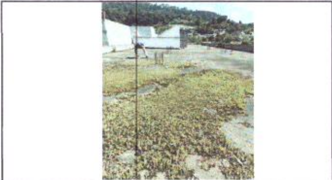
Estado actual del deterioro del segundo nivel.