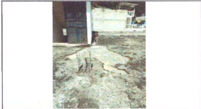
Estado actual del deterioro del segundo nivel.