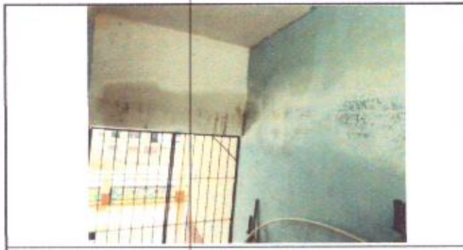
Estado actual de la estructura del segundo nivel.