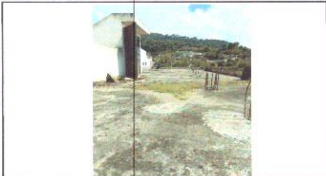
Estado actual del deterioro del segundo nivel.