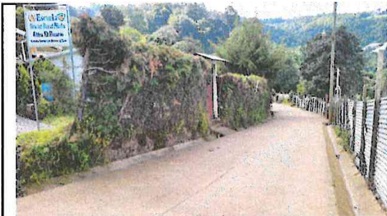
Foto 4: desde este espacio el mejoramiento al muro, incluye mampostería reforzada.