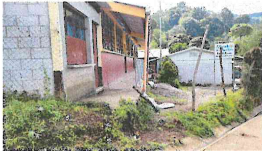
Foto 3: en este espacio tenemos prevista la instalación de un portón metálico.