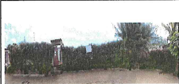
Foto 2: se realizara el mejoramiento al muro de mamposteria reforzada de 57ml con altura de 2.50m con su espectivo cimientó.