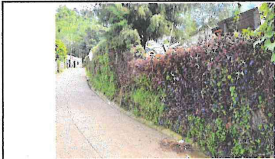
Foto 1: se realiza el mejoramiento del área perimetral en esta parte frontal de la escuela muro de block.