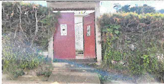
Foto 5: se cambia el cerco de malla y de cipres existentes por seguridad de los niños