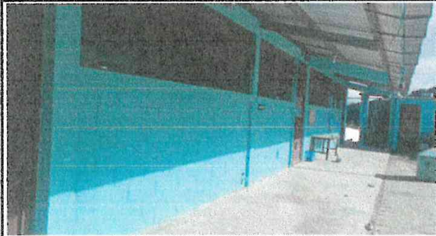
Foto1: Cambio de pintura exterior de la escuela y salones de clases.