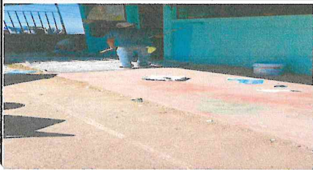
Foto1: Cambio de pintura exterior de la escuela y salones de clases.