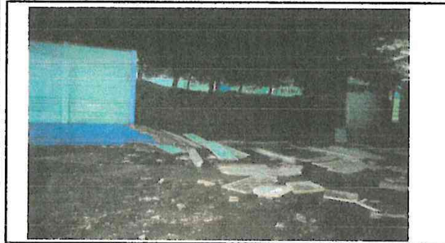
Foto1: Muro Perimetral colapsado (Área de trabajo 1)