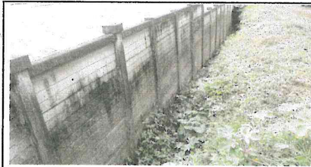
Foto 3: Muro perimetral y de contención colapsando desde el exterior (Área 2)