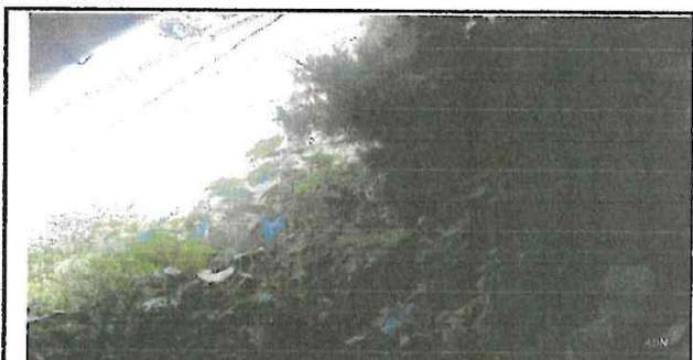
Foto 6: Área a trabajar el muro de contención (Área de trabajo 2)

Observación: Si es necesario se pueden agregar hojas adicionales y actualizar el número de hojas.