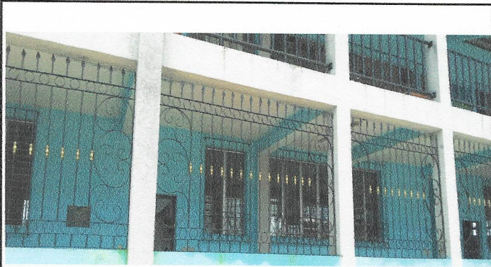
Foto1: Mantenimiento de puertas y balcones