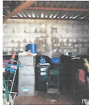
Foto 4: Se tienen que realizar varias modificaciones en este lugar.