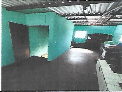
Foto1: Actualmente la cocina se encuentra ubicada en un segundo nivel y esta muy mal diseñada.