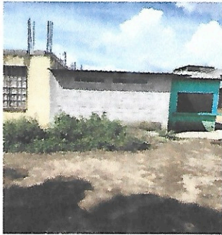
Foto 3: Actualmente contamos con una bodega; se piensa trasladar y ampliar la cocina en este lugar.