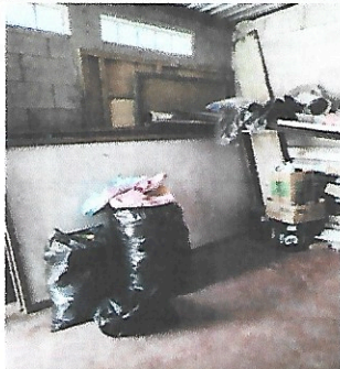
Foto 5: Para este proyecto se necesita mejorar el sistema de drenaje, agua y luz.