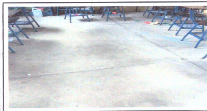
Foto 5: Modulo B: Piso de concreto rustico, no posee piso de granito o cerámico.