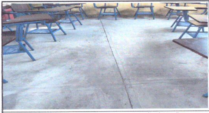
Foto 6: Modulo B: Piso de concreto rustico, no posee piso de granito o cerámico.

Observación: Si es necesario se pueden agregar hojas adicionales y actualizar el número de hojas.