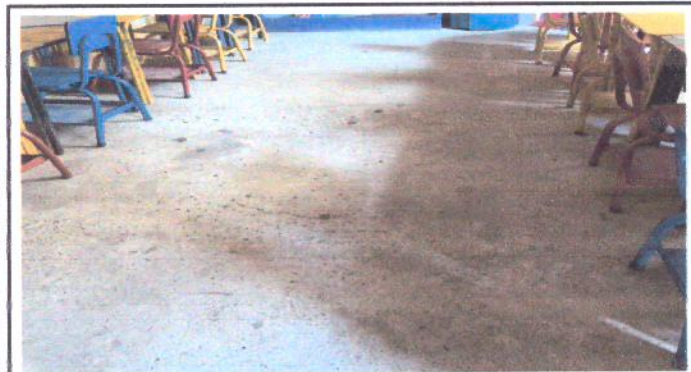
Foto 3: Modulo B: Piso de concreto rustico, no posee piso de granito o cerámico.