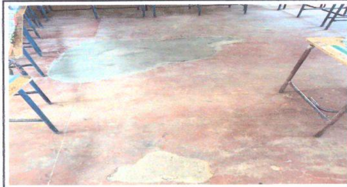
Foto1: Modulo A: Piso deteriorado con agujeros.