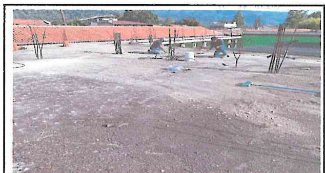
Foto 4: La terraza mantiene agua estancada y filtraciones en el área