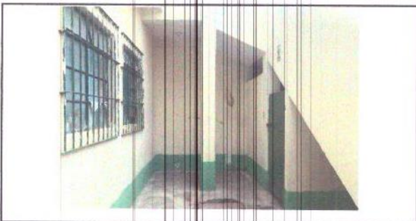
Foto 5: Trabajo en baño planta baja, instalación de dos lavamanos, instalación de dos inodoros, una puerta de metal, eliminación y levantado de muro, instalación de azulejos, instalación de piso, pintura