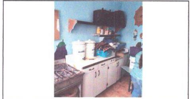
Foto 2: Cambio de puerta de metal, ventana PVC, balcón de metal, mueble de cocina de concreto con puerta de madera, pintura general y reubicación de puerta principal de ingreso