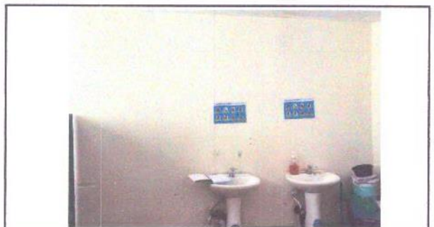
Foto 4: Trabajo en baños, instalación de azulejos, cambio de dos grifos, pintura general en puertas