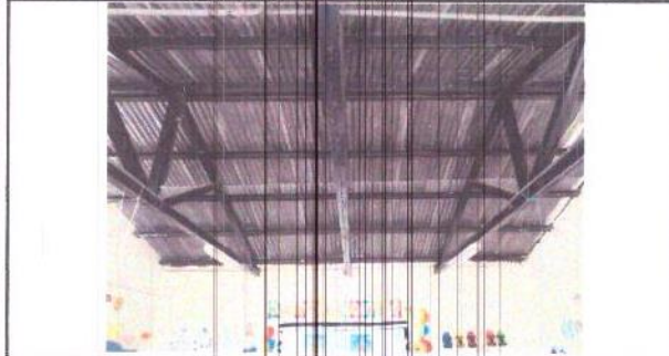
Foto 1: Necesidad de cambio de techo de lámina en el salón de Párvulos 1 Sección A. Es necesario instalar techo termo aislante, cielo falso y lámparas