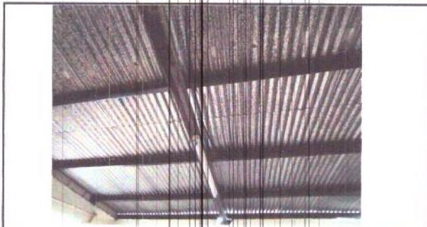
Foto 3: Cielo falso vinílico, termoaislante y lámparas en salón del segundo nivel del primer edificio