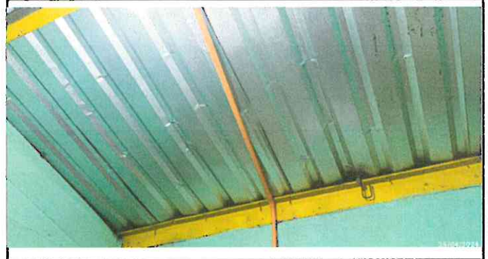
Foto 2: Reparación de láminas para protección y resguardo de documentos de dirección.