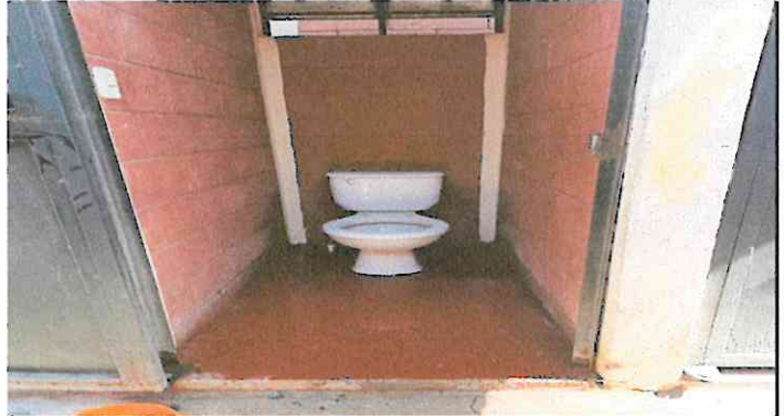
Foto 2: Reparación para nuevos sanitarios y repación de ventanas,