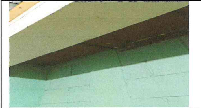
Foto 3: Cambio de canal de agua, para evitar la filtración de agua que perjudica en tiempo de lluvia.