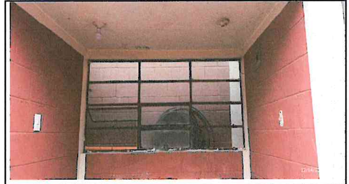
Foto 4: Reparación de ventanas e instalación de vidrios para los 5 espacios de los sanitarios.