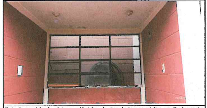
Foto 6: cambio de sistema eléctrico dentro de los servicios sanitarios y de la pils en uso por el centro educativo.

Observación: Si es necesario se pueden agregar hojas adicionales y actualizar el número de hojas.