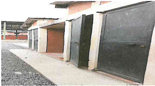
Foto1: Reparación de 4 sanitarios, cambio chapas y sus llaves.