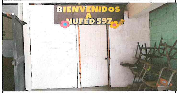
Foto 4: Cambio de fachada de material de las planchas de pleywood para la protección de dirección.