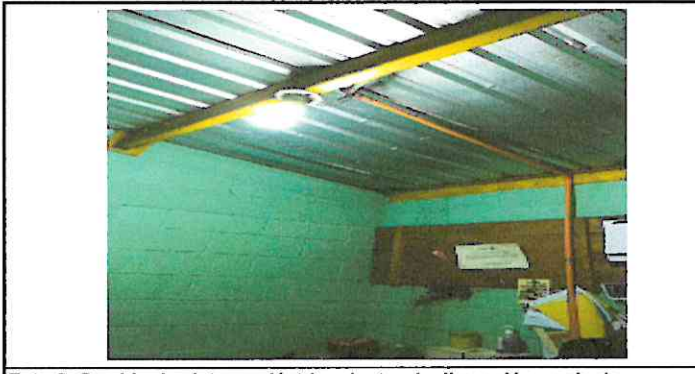
Foto 5: Cambio de sistema eléctrico dentro de dirección y sala de atención a padres de familia.