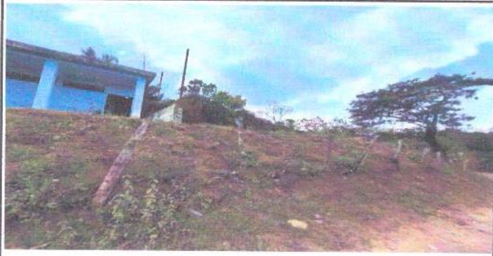
CERCO DE POSTES DE MADERA Y ALAMBRE DE PÚAS QUE FRECUENTEMENTE SON DESTRUIDOS POR PEERSONAS AJENAS A LA COMUNIDAD EDUCATIVA.