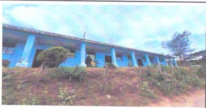
VISTA FRONTAL DE LAS AULAS DESDE LA CALLE.