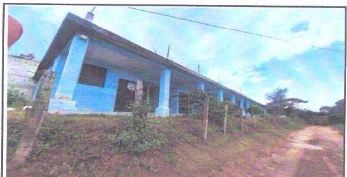
VISTA LATERAL DE LAS AULAS DESDE LA CALLE.