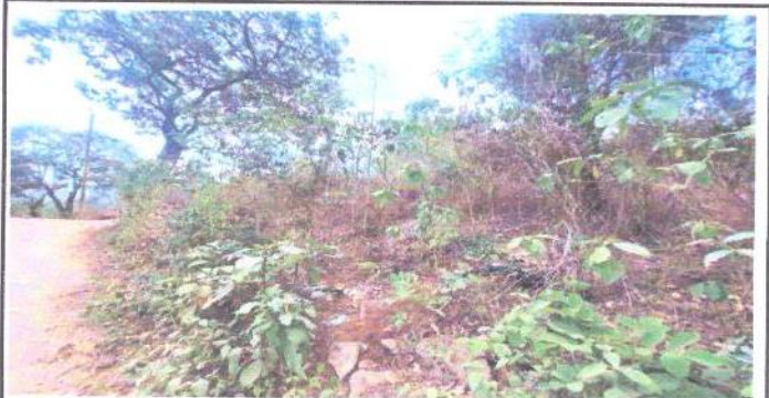
ÁREA PERÍMETRAL DE ALAMBRE Y PÚAS QUE FRECUENTEMENTE ESTÁ EN RIESGO DE SER BASURERO CLANDESTINO Y ESCONDITE DE PERSONAS AJENAS A LA COMUNIDAD EDUCATIVA.