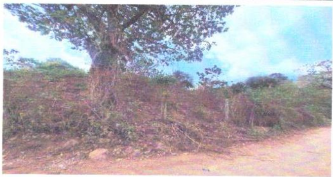
FONDO DEL CERCO A SER REMOZADO, QUE PERTERNECE AL INSTITUTO.