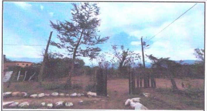
ENTRADA AL INSTITUTO POR MEDIO DE UN PORTÓN PEQUEÑO HECHO DE LÁMINAS DE SEGUNDO USO.