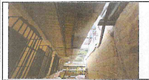
Foto 5: CAMBIO DE CANALES Y BAJADAS DE AGUAS PLUVIALES ASI COMO PINTURA DE AULAS INTERIORES Y ETERIORES