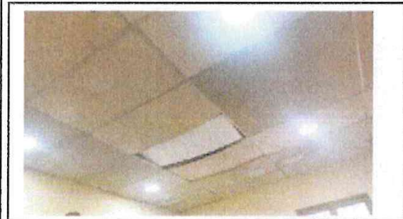
Foto 1: CAMBIO DE CIELO FALSO QUE SE ENCUENTRA EN MAL ESTADO POR EL TIEMPO DE USO, EN TODOS LOS ESPACIOS QUE TIENEN ESE INCOVENIENTE Y PINTURA DE ALULAS