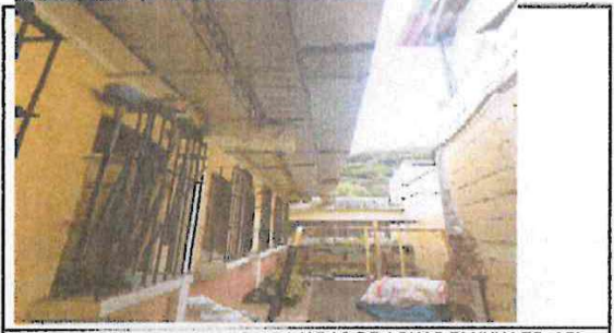
Foto 6: CAMBIO DE CANALES Y BAJADAS DE AGUAS PLUVIALES ASI COMO PINTURA DE AULAS INTERIORES Y ETERIORES

Observación: Si es necesario se pueden agregar hojas adicionales y actualizar el número de hojas.