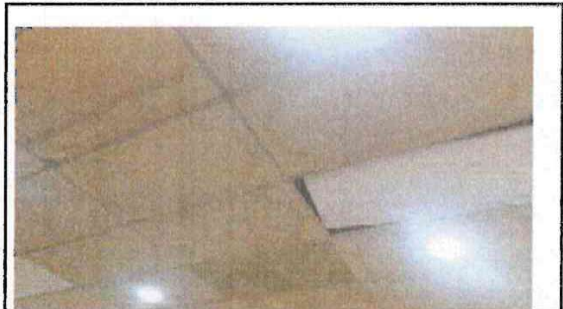
Foto 2: CAMBIO DE CIELO FALSO QUE SE ENCUENTRA EN MAL ESTADO POR EL TIEMPO DE USO Y PINTURA DE AULAS