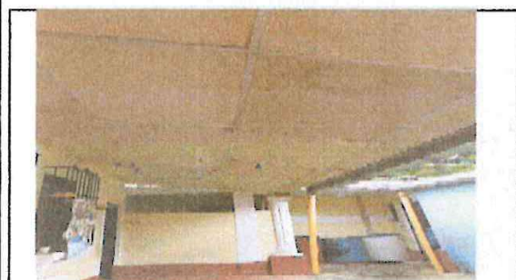
Foto 3: CAMBIO DE CIELO FALSO EN LOS CORREDORES QUE SE ENCUENTRAN EN MAL ESTADO POR TIEMPO DE USO Y CONSTRUCCION DE PARED PREFABRICADA