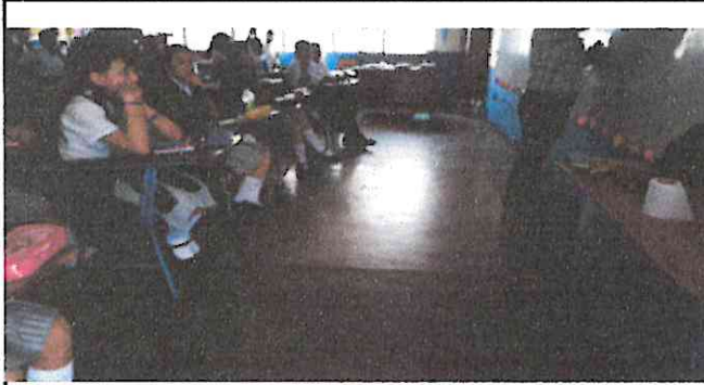
Foto1: Así lucen los salones de 6to A, 6to B y 5to B antes de ser remozados. Solo era una torta de concreto.