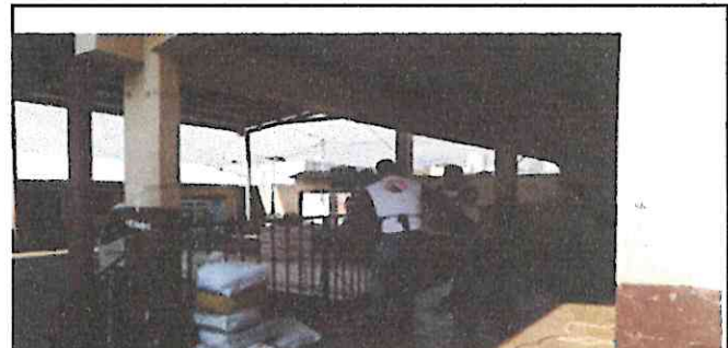
Foto 6: Personal de la ferreteria donde hemos comprado los materiales para dar inicio al remozamiento.

Observación: Si es necesario se pueden agregar hojas adicionales y actualizar el número de hojas.