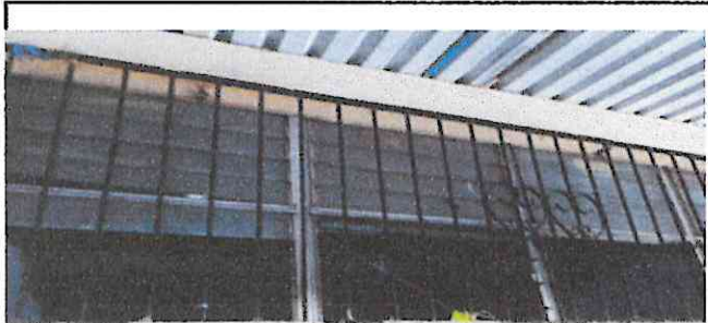
esta es la foto de la ventana de 6to B como podemos ver no es suficiente para que haya ventilación.