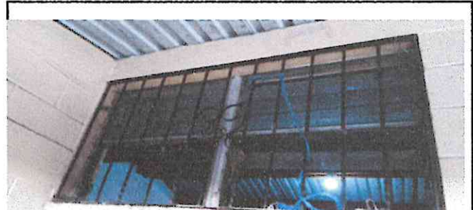
Foto 4: Esta es la ventana de 6to A de igual forma no suficiente para que haya ventilación.