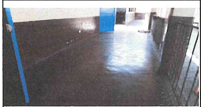
Esta foto nos representa el corredor que usamos como escenario de igual forma solo tiene una torta de concreto.