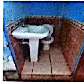
Foto 6: FOTOGRAFIA SUMISTRO E INSTALACION DE AZULEJO, LAVAMANOS CON PEDESTAL