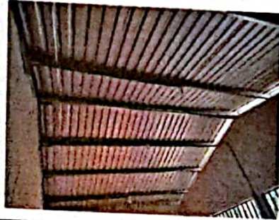
Foto 8: FOTOGRAFIA SUMINISTRO E INSTALACION DE ESTRUCTURA PORTANTE DE METAL, LAMINA TROQUELADA