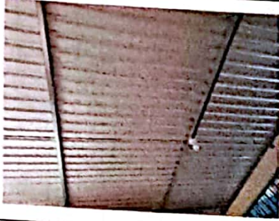
Foto 7: FOTOGRAFIA SUMINISTRO E INSTALACION DE ESTRUCTURA PORTANTE DE METAL, LAMINA TROQUELADA