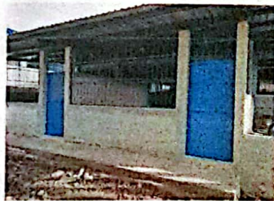
Foto 5: FOTOGRAFIA MEJORAMIENTO DE MURO EN AULA, SUMIESTRO DE PUERTAS, BALCONES