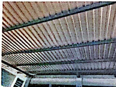
Foto 10: FOTOGRAFIA SUMINISTRO E INSTALACION DE ESTRUCTURA PORTANTE DE METAL, LAMINA TROQUELADA