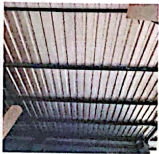
Foto 7: FOTOGRAFIA SUMINISTRO E INSTALACION DE ESTRUCTURA PORTANTE DE METAL, LAMINA TROQUELADA