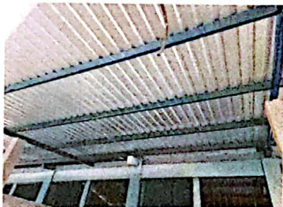
Foto 9: FOTOGRAFIA SUMINISTRO E INSTALACION DE ESTRUCTURA PORTANTE DE METAL, LAMINA TROQUELADA