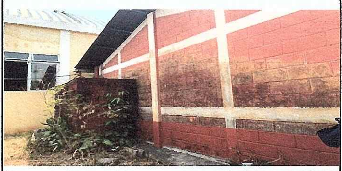
FOTO 4: Se observa el mal estado del muro, urge repello de aulas y baño.