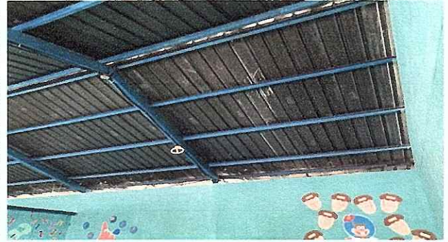
FOTO 8: Se observa el mal mantenimiento del sistema eléctrico, urge reparación.