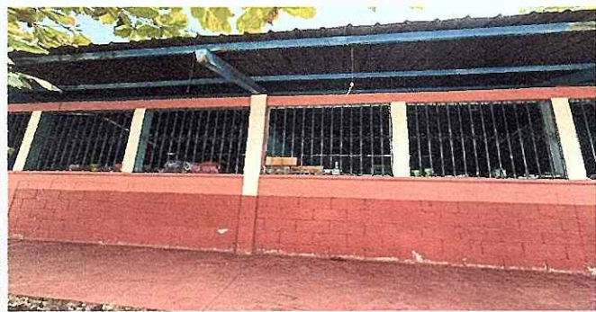
FOTO 9: Se observa el mal estado de balcones, urge mantenimiento.