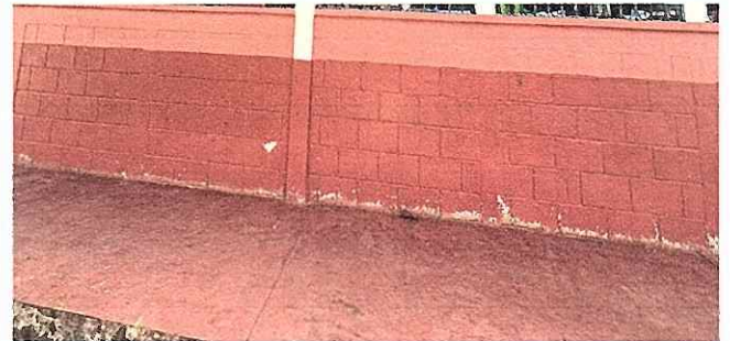
FOTO 12: Se observa el mal estado del piso, urge sustitucion a piso antideslizante.

Observación: Si es necesario se pueden agregar hojas adicionales y actualizar el número de hojas.