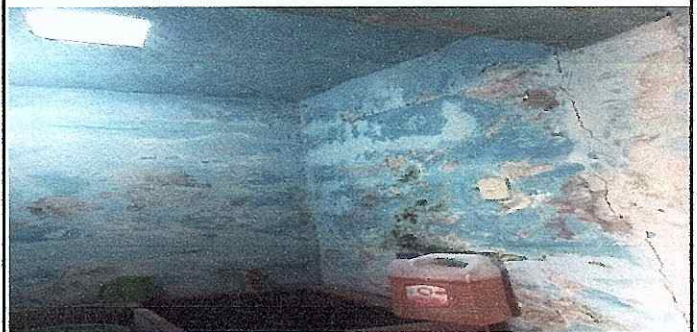
FOTO 16: Se observa el mal estado de las paredes y la falta de pintura en las mismas.