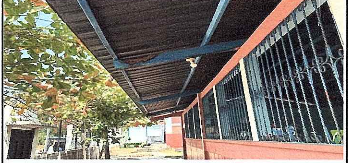
FOTO 2: Se observa el mal estado de las estructuras de soporte, urge mantenimiento.