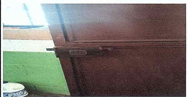
FOTO 10: Se observa el mal estado de las chapas, urge sustitucion.