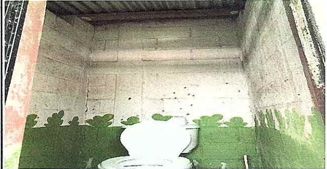
FOTO14: Se observa el mal estado de las paredes por falta de azulejo.