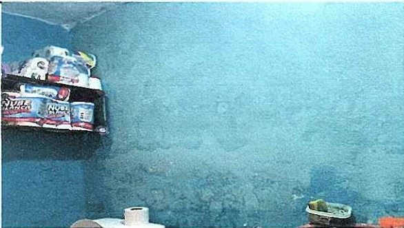
FOTO 11: Se observa el mal mantenimiento de la pared, urge instalacion de azulejo.