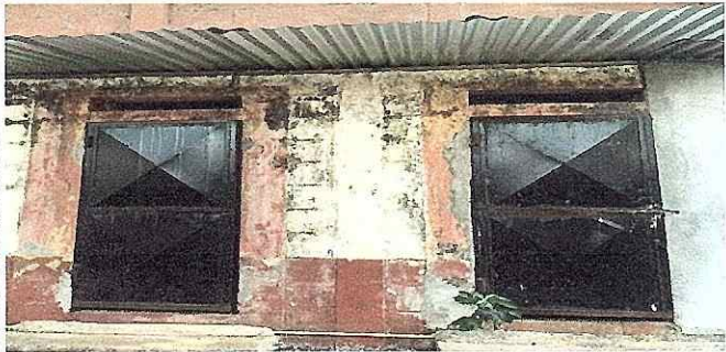
FOTO 13: Se observa el oxido y el mal estado de las puertas de los sanitarios.