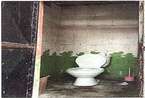
FOTO 15: Se observa el piso rustrico , urge cambio a piso antideslizante.