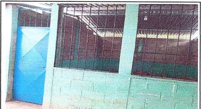
Foto 2: Se observa que en vez de maya se colocaron balcones y se cambio la puerta de madera por metal.