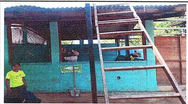
Foto 3: Se puede observar el trabajo de levantado de pared de block y colocación de piso cerámico.