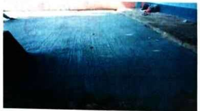
Foto 4: Pavimento de concreto en el patio de la escuela ya terminado