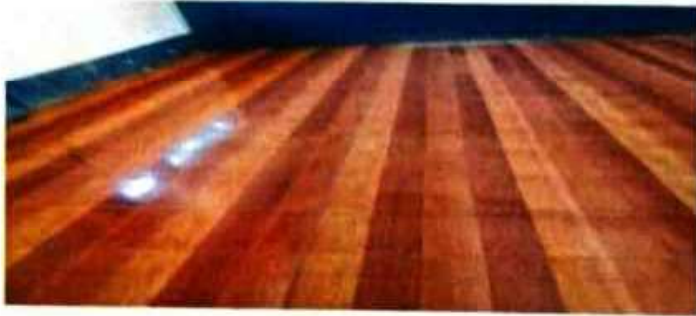
Foto1: Aula ya con piso cerámico terminado