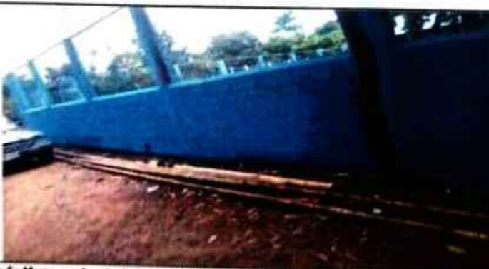
Foto 5: Muro perimetral ya con pintura nueva aplicada y terminado