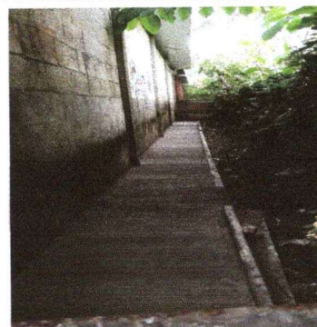
Foto 4: Se puede observar la sustitución de la banqueta de concreto.