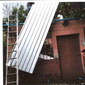
Foto 6: Se puede observar el inicio del cambio de la estructura de soporte de metal.

Observación: Si es necesario se pueden agregar hojas adicionales y actualizar el número de hojas.