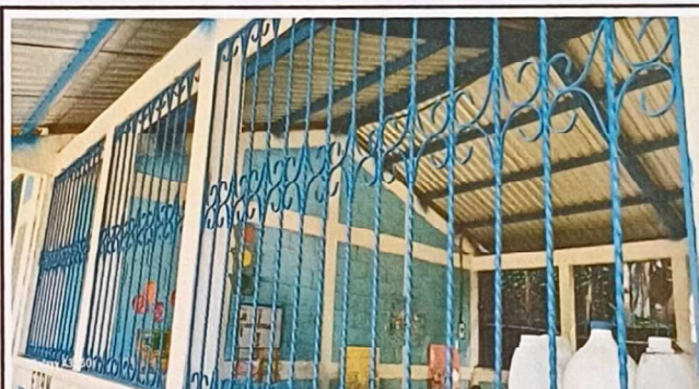
Foto 4: Se observa que a los balcones se le ha dado el mantenimiento requerido en su totalidad.