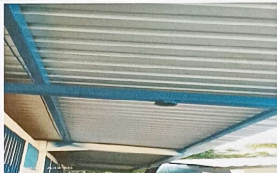
Foto 2: Se observa que se le ha dado el mantenimiento requerido total para la estructura de soporte de metal