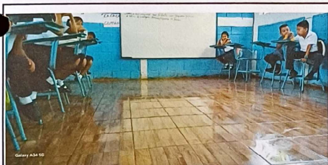
Foto 5: Se observa que el piso ha sido sustituido en su totalidad