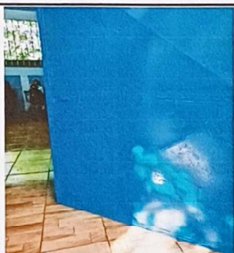
Foto 3: Se observa que a las puertas se le ha dado el mantenimiento necesario.