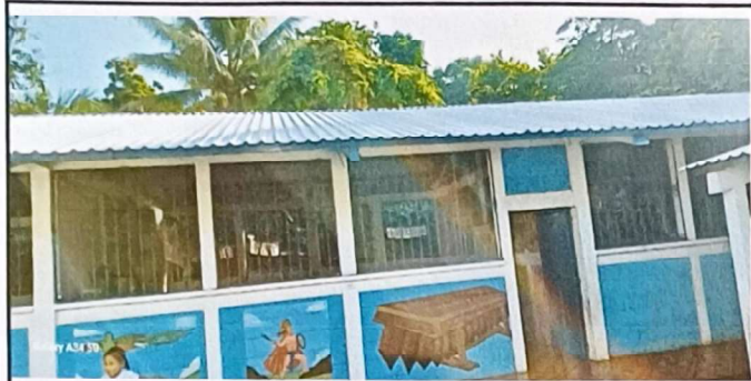
Foto 1: Se observa que se ha sustituido totalmente la lámina dañada