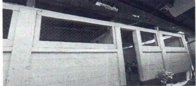
Foto 4: Se observa que los balcones necesitan ser sustituidos con urgencia