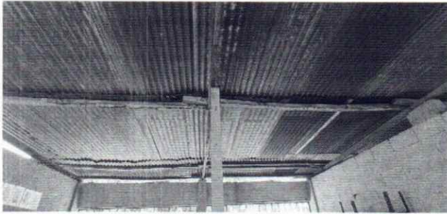
Foto 1: Se observa lámina dañada y estructura de soporte de madera necesita sustitución urgente.