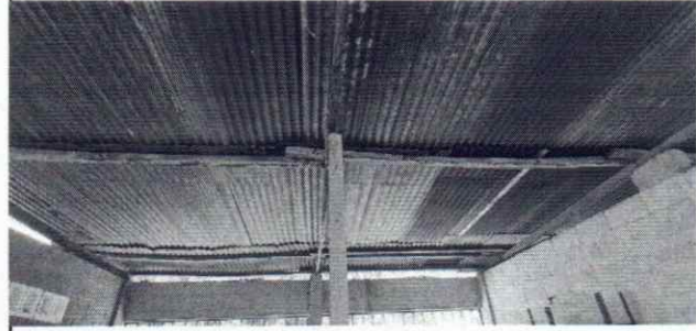
Foto 2: Se observa que el aula carece de mojinete y la altura no es la adecuada.