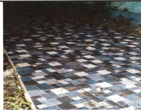
Foto 10: Se observa el proceso de colocación de piso antideslizante.