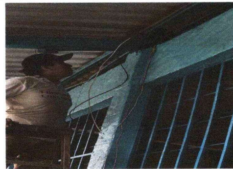
Foto 12: Se observa el proceso de mejoramiento del sistema eléctrico.

Observación: Si es necesario se pueden agregar hojas adicionales y actualizar el número de hojas.