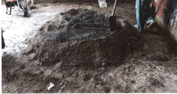
Foto 7: Se observa el proceso de mejoramiento de la torta de concreto.