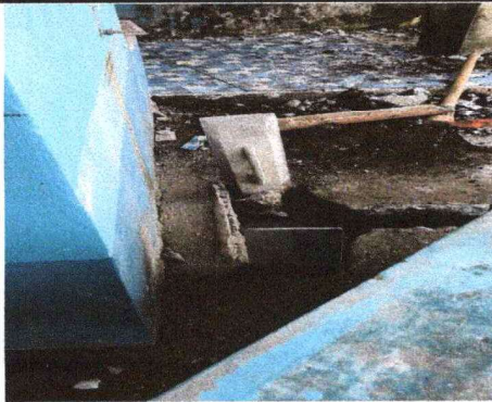
Foto 9: Se observa el proceso de mejoramiento de tuberías de aguas negras.