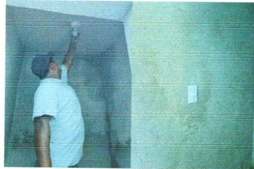
Foto 10: Colocación del suministro de sistema eléctrico, luminarias y apagadores.