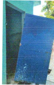
Foto 8: Se desmontan las puertas de los baños para darle mantenimiento y ser lijadas, cepilladas y pintadas.