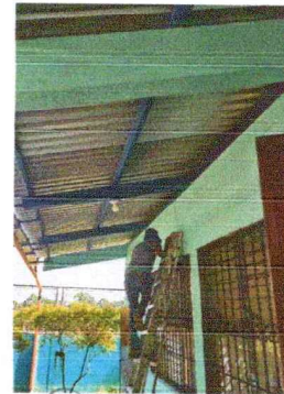
Foto 4: Se empiezan a dar mantenimiento a la estructura de soporte de metal que se encuentran deterioradas.