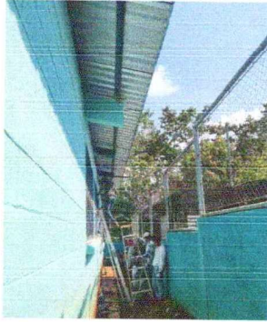
Foto 1: Se observa como se trabaja en la colocación del canal de metal para el desfogue de agua pluvial.