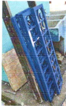
Foto 9: Se observan el suministro de balcones de metal que serán colocados en los espacios faltantes de los baños.