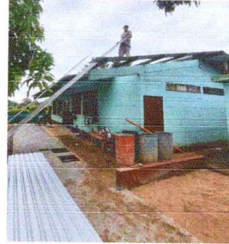
Foto 2: Se inicia con el cambio de las láminas deterioradas por lámina troquelada aluzinc calibre 26.