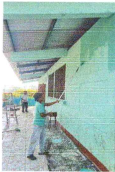
Foto 5: Se inicia la aplicación de pintura de látex acrílica en muros de interiores y exteriores del centro educativo.