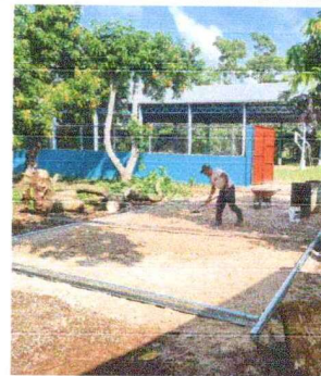
Foto 12: Se da inicio a la reparación de la plancha de concreto de patio que da el ingreso al centro educativo.

Observación: Si es necesario se pueden agregar hojas adicionales y actualizar el número de hojas.