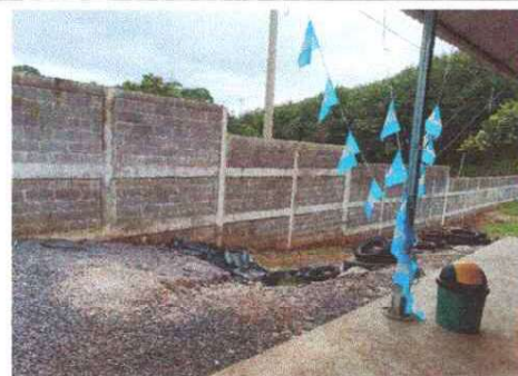
Foto 18: Se observa la necesidad de aplicar el repello en los muros

Observación: Si es necesario se pueden agregar hojas adicionales, en los cuadros el número de hojas.