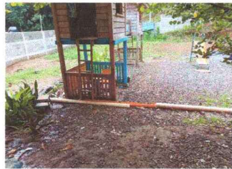
Foto 16: Se observa la necesidad de sustituir la tubería de pvc de línea principal de aguas pluviales