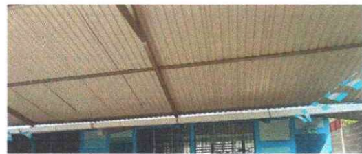
Foto 12: Se observa la necesidad de sustituir el canal de pvc por metal

Observación: Si es necesario se pueden agregar hojas adicionales y actualizar el número de hojas.