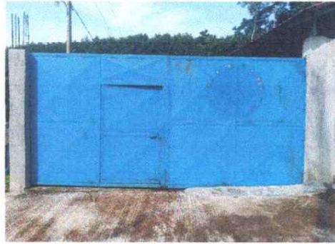
Foto 14: Se observa la necesidad de darle mantenimiento del porton