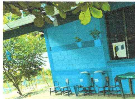
Foto 6: Se observa la necesidad de conformar ventana y colocacion de un balcon

Observación: Si es necesario se pueden agregar hojas adicionales y actualizar el número de hojas.