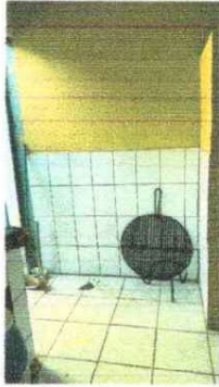
Foto 1: Se necesita la realización de una estufa rural, se observa el sitio donde esta se colocara