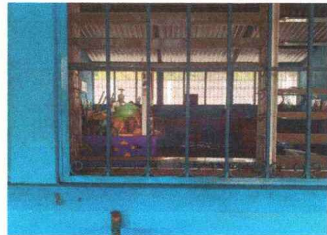
Foto 10: Se observa la necesidad de reposicion de los vidrios de las ventanas