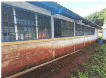
Foto 11: Se observa la necesidad de darle mantenimiento a la ventana de metal