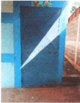
Foto 9: Se observa la necesidad de darle mantenimiento a las puertas