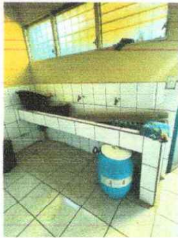
Foto 3: Se observa la necesidad de crear un banco de cocina e instalar el sistema eléctrico, se observa el sitio donde se colocara