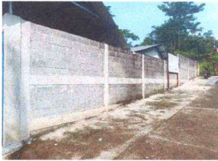
Foto 13: Se observa la necesidad de aplicar alisado y pintura en muros