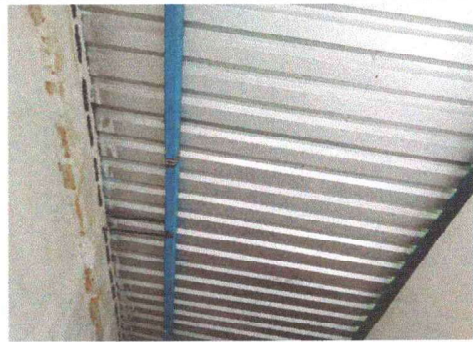
Foto 12: Se observa como quedo la estructura de metal ya finalizada

Observación: Si es necesario se pueden agregar hojas adicionales y actualizar el número de hojas.