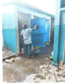
Foto 8: Se observa el mantenimiento de las puerta de los servicios sanitarios