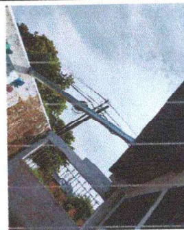
Foto 12: Se observa el cambio de la estructura de madera por metal

Observación: Si es necesario se pueden agregar hojas adicionales y actualizar el número de hojas.