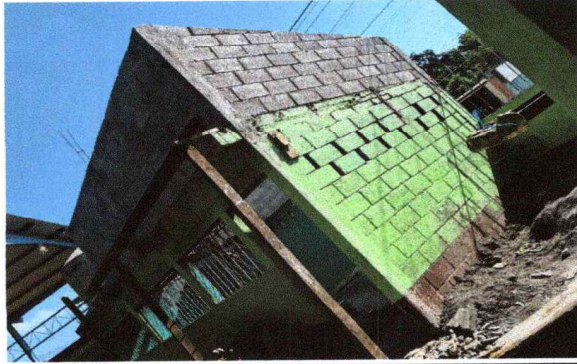
Foto 7: Se observa como se están colocando las hiladas de block conformando el muro.