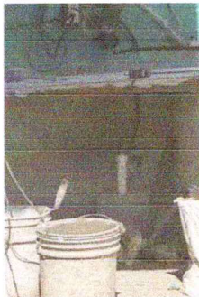
Foto 5: proceso de instalación de piso cerámico abajo de gabinete en cocina