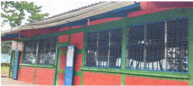
Foto 9: Se observa la necesidad de colocar canal pues ya no es funcional