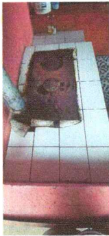
Foto 5: Se observa la necesidad de cambiar la plancha de la estufa