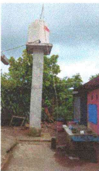
Foto 11: Se observa la necesidad de sustituir la tubería de línea principal