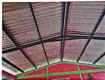
Foto 4: FOTOGRAFIA SUMINISTRO E INSTALACION DE ESTRUCTURA PORTANTE DE META, LAMINA TROQUELADA CALIBRE 26