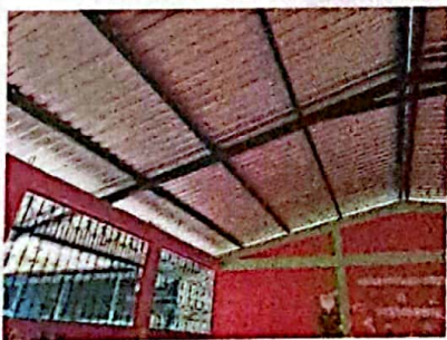
Foto 5: FOTOGRAFIA SUMINISTRO E INSTALACION DE ESTRUCTURA PORTANTE DE META, LAMINA TROQUELADA CALIBRE 26