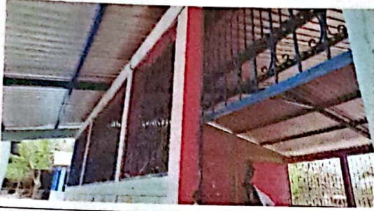
Foto 7: FOTOGRAFIA SUMINISTRO E INSTALACION DE ESTRUCTURA PORTANTE DE META, LAMINA TROQUELADA CALIBRE 26