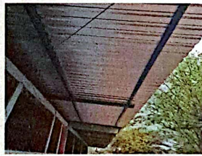
Foto 6: FOTOGRAFIA SUMINISTRO E INSTALACION DE ESTRUCTURA PORTANTE DE META, LAMINA TROQUELADA CALIBRE 26