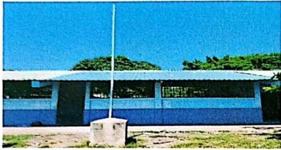
Foto1: Se observa el cambio de lámina