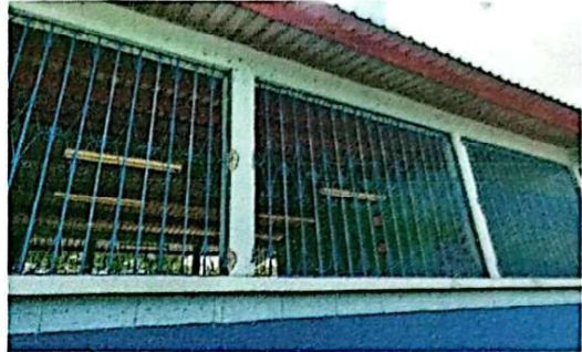
Foto 2: Se observa el cambio de la estructura de metal de los balcones.