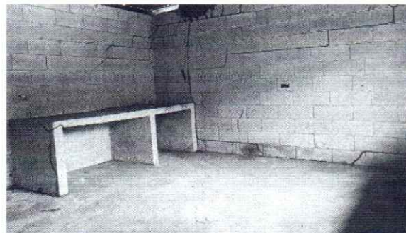
Foto 6: Se observa la necesidad en la cocina de implementar una estufa rural, instalar piso antideslizante e implementar azulejo.

Observación: Si es necesario se pueden agregar hojas adicionales y actualizar el número de hojas.