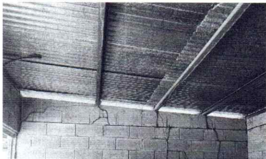
Foto 5: Se observa que es necesario realizar el cambio del techo de la cocina dado que se encuentra en mal estado.