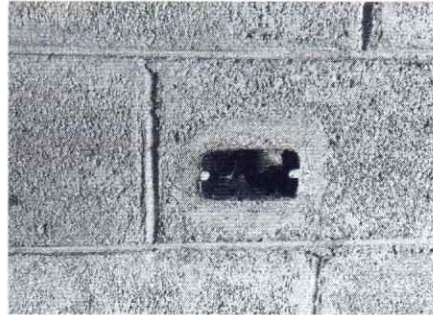
Foto 2: Se observa que el sistema eléctrico del módulo 1, 3 y 4 se encuentra en mal estado y debe sustituirse.