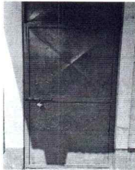
Foto 3: Se observa que la puerta se encuentra en mal estado y es necesario la sustitución.