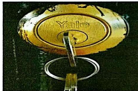
Foto 4: Se observa finalizado el cambio de la chapa en puerta de aula.