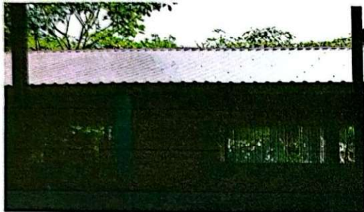
Foto1: Se observa el trabajo de cambio de lámina terminado.