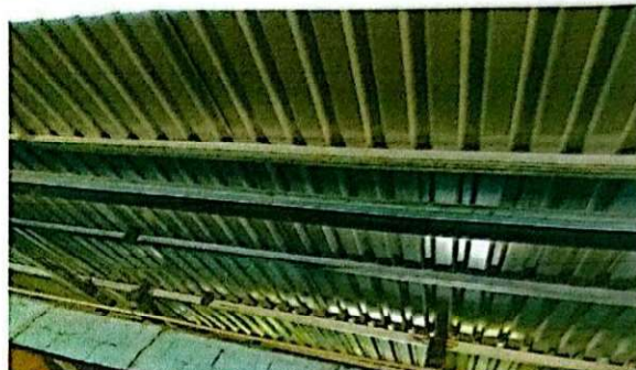
Foto 2: Se observa el cambio de la estructura de madera por la de metal ya finalizado.