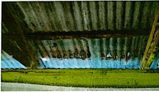
Foto 1: Se observa que la lámina de zinc, se encuentra en mal estado, modulo 1