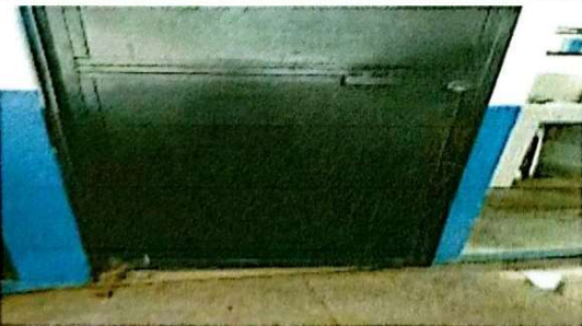
Foto 5: Se observa en mal estado la estructura de la puerta de metal por la parte de abajo