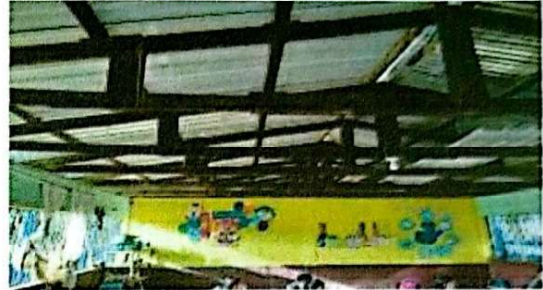
Foto 2: Se observa que la estructura de madera se encuentra en mal estado.