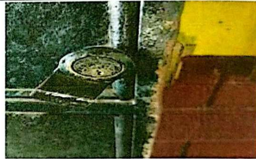
Foto 4: Se observa el mal estado de la chapa en puerta de modulo 3