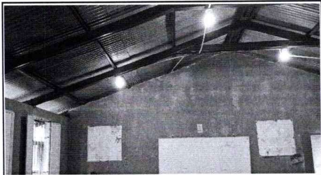
Foto 2: terminacion del sistema electrico, en los modulos y pasillo del centro educativo.