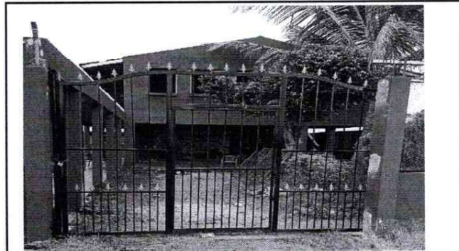
Foto 4: culminacion de la sustitucion del porton de la entrada principi del centro educativo.