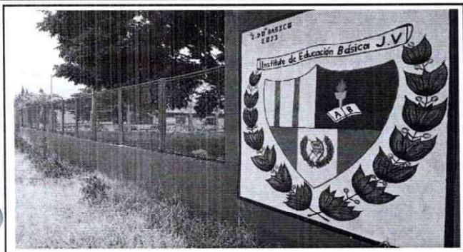
Foto 1: Ejecución en su totalidad de la aplicación de pintura del interior y exterior del centro educativo.