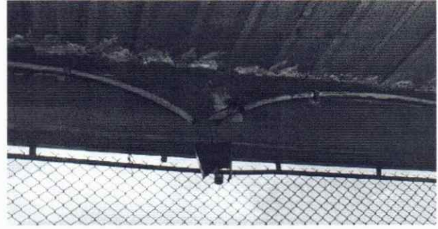
Foto 2: Se observa necesario realizar la sustitución de Sistema Eléctrico.