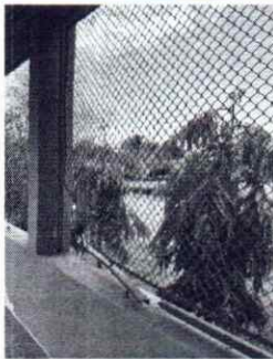
Foto 5: Se observa las malas condiciones de la malla de la cerca perimetral por tal razón es necesario realizarlo mantenimiento.