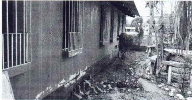
Foto 1: Se observan la pintura del módulo 2 y 3 en malas condiciones, es necesario la aplicación de pintura.