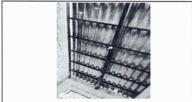
Foto 3: La estructura de soporte se encuetrna muy deteriorada, picada y oxidada