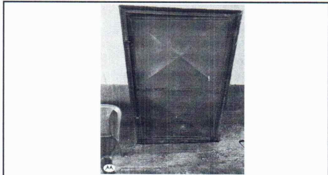
Foto 1: Se observa el mal estado de la puerta, se requiere de sustitución.