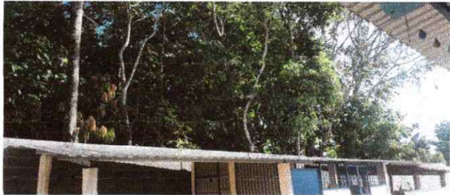
Foto 1: Se observa el montaje de la lamina en la cocina terminado.