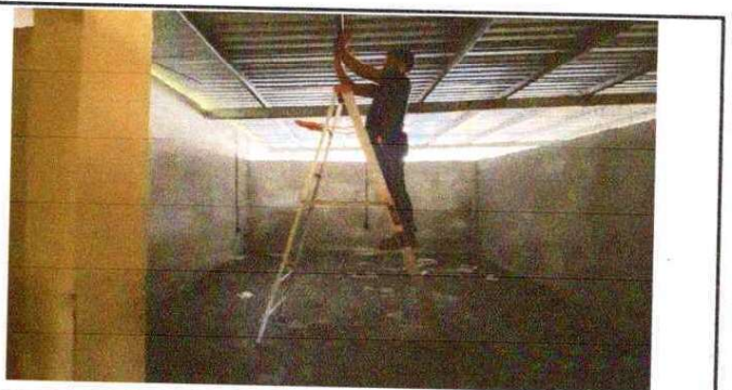
Foto 5: Se observa instalacion de energia eléctrica en aulas puras