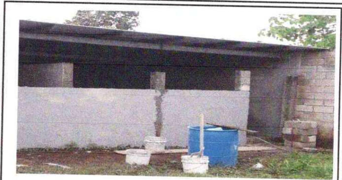
Foto 2: Se observa aplicación de Mantenimiento (repello)a los muros exteriores e interiores