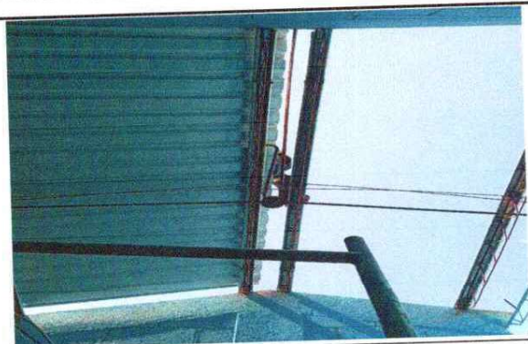
Foto 9: Se observa sustitución de techo en Dirección que estaba en mal estado