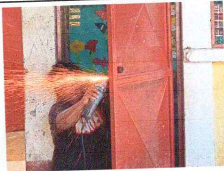
Foto 8: Se observa cambio de chapas en puertas que no funcionan correctamente