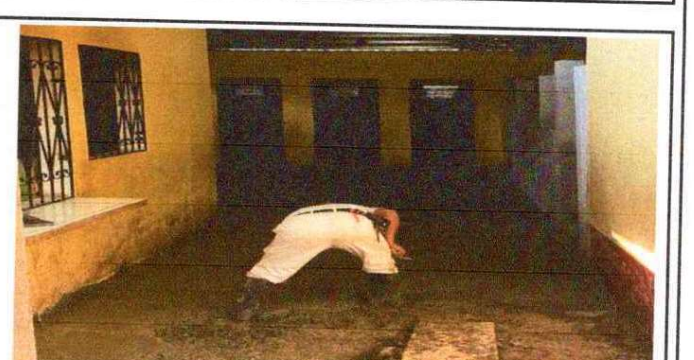
Foto 6: Se observa la aplicación de torta de concreto en área exterior de cocina.

Observación: Si es necesario se pueden agregar hojas adicionales y actualizar el número de hojas.