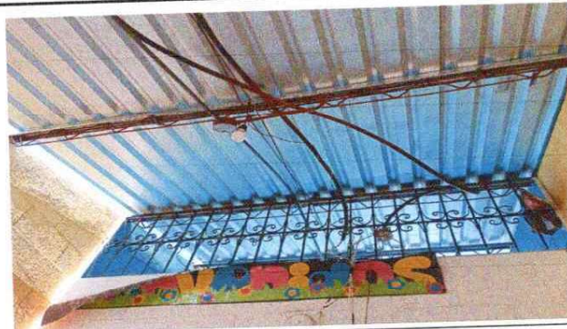
Foto 10: Se observa aplicación de mantenimiento en estructura de soporte de metal( lijado, cepillado, y aplicación de pintura anticorrosiva)