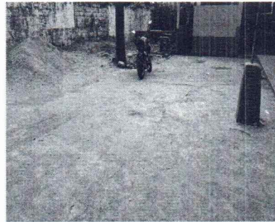
Foto 8: Se observa que el patio frontal de la escuela se encuentra en mal estado, es necesario su reparación de piso de torta de concreto.