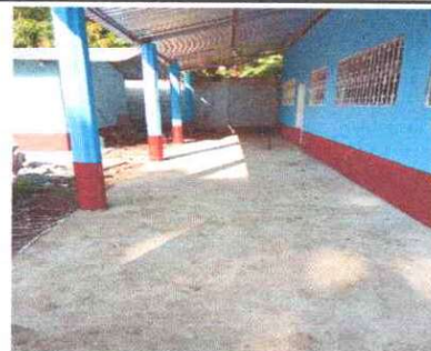
Foto 6: Se observa que la torta de concreto en área exterior del aula del modulo II fue colocada.

Observación: Si es necesario se pueden agregar hojas adicionales y actualizar el número de hojas.