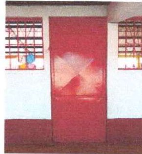
Foto 12: Se observa que se les dio mantenimiento a puertas en aulas del modulo I

Observación: Si es necesario se pueden agregar hojas adicionales y actualizar el número de hojas.