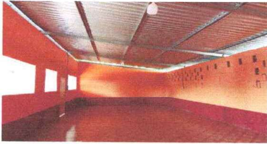
Foto 7: Se observa que en las aulas fue aplicada la pintura en el modulo II