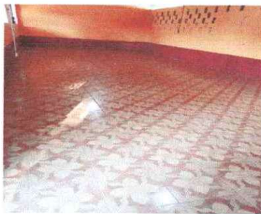
Foto 5: Se observa que el piso fue sustituido por piso cerámico del modulo II