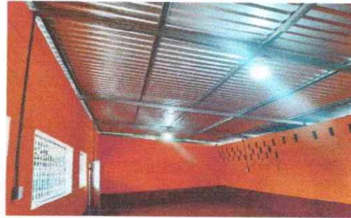
Foto 8: Se observa que las aulas ya cuentan con energía eléctrica del modulo II