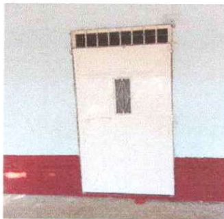
Foto 3: Se observa que se dio el mantenimiento de puertas en aulas del modulo II