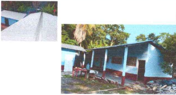
Foto 1: Se observa que el techo de modulo II fue sustitucion completamente.