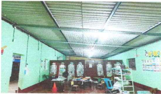
Foto 9: Se observa que las aulas ya cuentan con energía eléctrica en modulo III