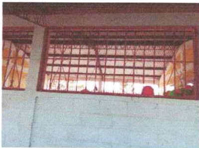
Foto 11: Se observa que en las aulas a los balcones de metal se les dio mantenimiento del modulo I