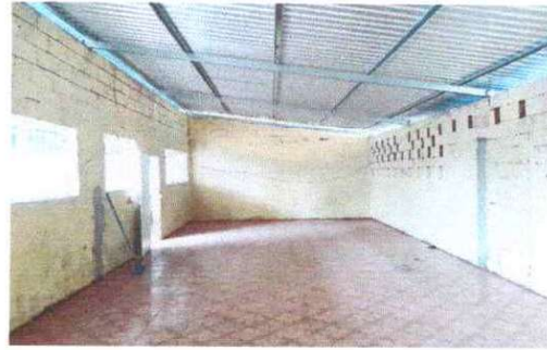
Foto 2: Se observa que la estructura de soporte de metal se le dio mantenimiento completamente a todo el modulo II