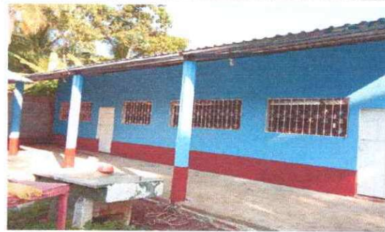
Foto 4: Se observan que los balcones de metal de las aulas se les dio el mantenimiento necesario en modulo II