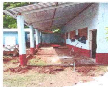
Foto 6: Se observa la preparación para colocar la torta de concreto en área exterior del aula del modulo II

Observación: Si es necesario se pueden agregar hojas adicionales y actualizar el número de hojas.