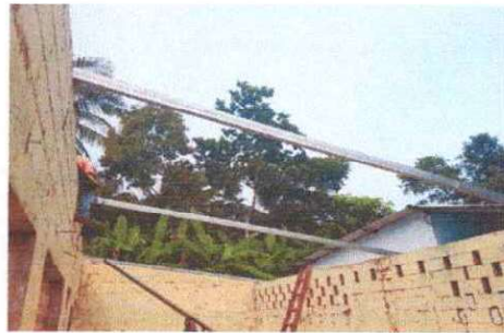
Foto 2: Se observa que la estructura de soporte de metal esta siendo colocada del modulo II