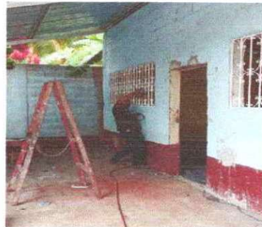
Foto 4: Se observan que están dándole mantenimiento a los balcones de metal de las aulas en modulo II