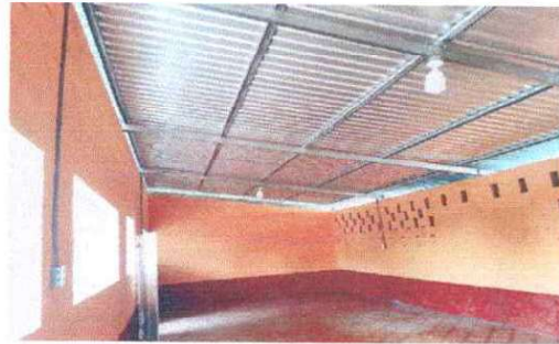
Foto 8: Se observa que en las aulas ya se instaló la energía eléctrica del modulo II