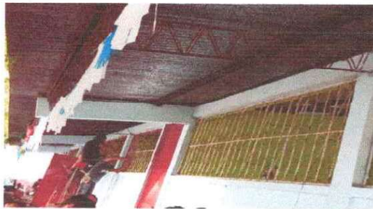
Foto 11: Se observa que en las aulas del modulo I a los balcones de metal se les está dando mantenimiento