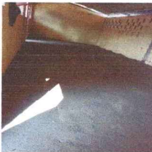
Foto 5: Se observa que el piso ya fue sustituido y preparado para colocar el piso cerámico del modulo II