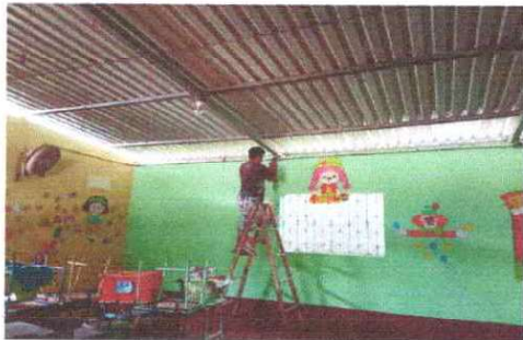
Foto 9: Se observa que las aulas se está instalando la energía eléctrica en modulo III