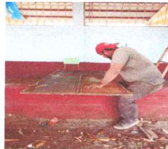
Foto 12: Se observa que se está dando mantenimiento a puertas en aulas del modulo I

Observación: Si es necesario se pueden agregar hojas adicionales y actualizar el número de hojas.