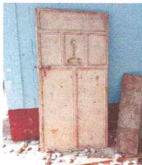
Foto 3: Se observa que se inicia el mantenimiento de puertas en aulas del modulo II