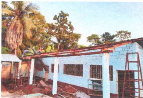
Foto 1: Se observa que el techo de modulo II esta En proceso de sustitución.