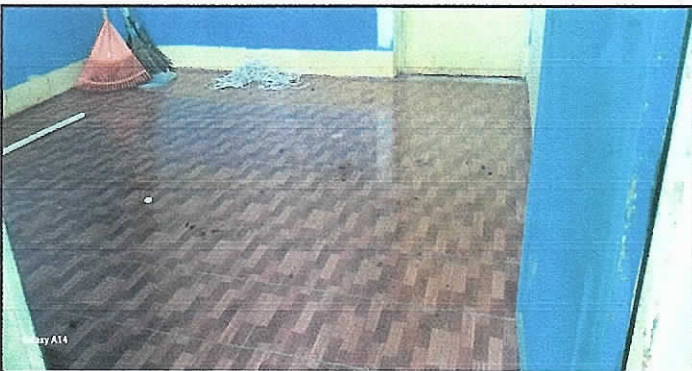
Foto 5: finalización de instalación de piso ceramico en dirección del establecimiento.