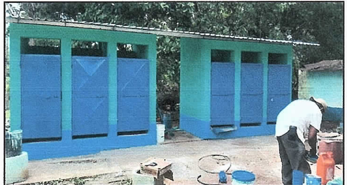
Foto 2: finalización de sustitución de lamina, estructura de soporte cambio de una puerta y mantenimiento de las mismas.