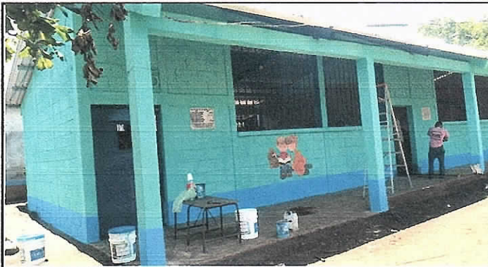
Foto1: finalización de sustitución de lamina, estructura de soporte, pintura, mantenimiento de puerta y sistema electrico