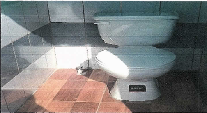
Foto 3: finalización de cambios de letrinas por baños lavables, pintura, piso ceramico y asulejo.