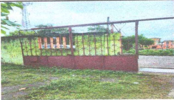
Foto 5: Se observa la necesidad de cambiar el portón ya que se encuentra en mal estado