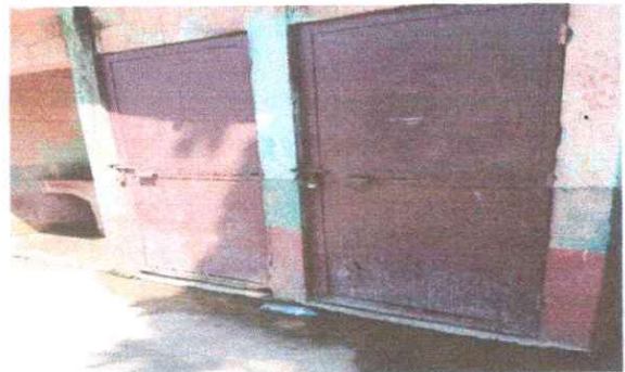
Foto 4: Se observa la necesidad de cambiar las puertas que ya están en mal estado