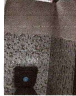
Foto 2: Se observa el proceso de instalación de los baños y el azulejo terminado.