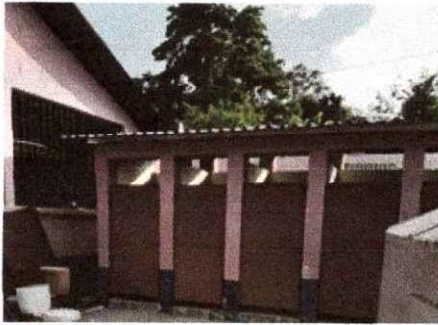
Foto 1: Se observa el proceso de fabricación e instalación de puertas terminado.