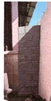
Foto 6: Se observa el proceso de conformación de muro finalizado.

Observación: Si es necesario se pueden agregar hojas adicionales y actualizar el número de hojas.