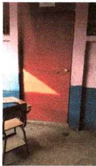
Foto 5: Se observa el proceso de elaboración e instalación de puertas terminado.