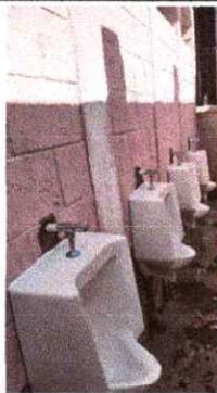
Foto 3: Se observa el proceso de instalación de migitorios terminado.